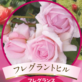
フレグラントヒル